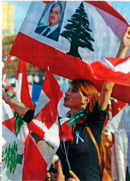
Seguidors de l'exprimer ministre libanès Hariri, assassinat al febrer, a Beirut.

—Que digui que l'economia té prioritat no significa que haguem de posposar les reformes polítiques. En els últims cinc anys l'economia pot haver