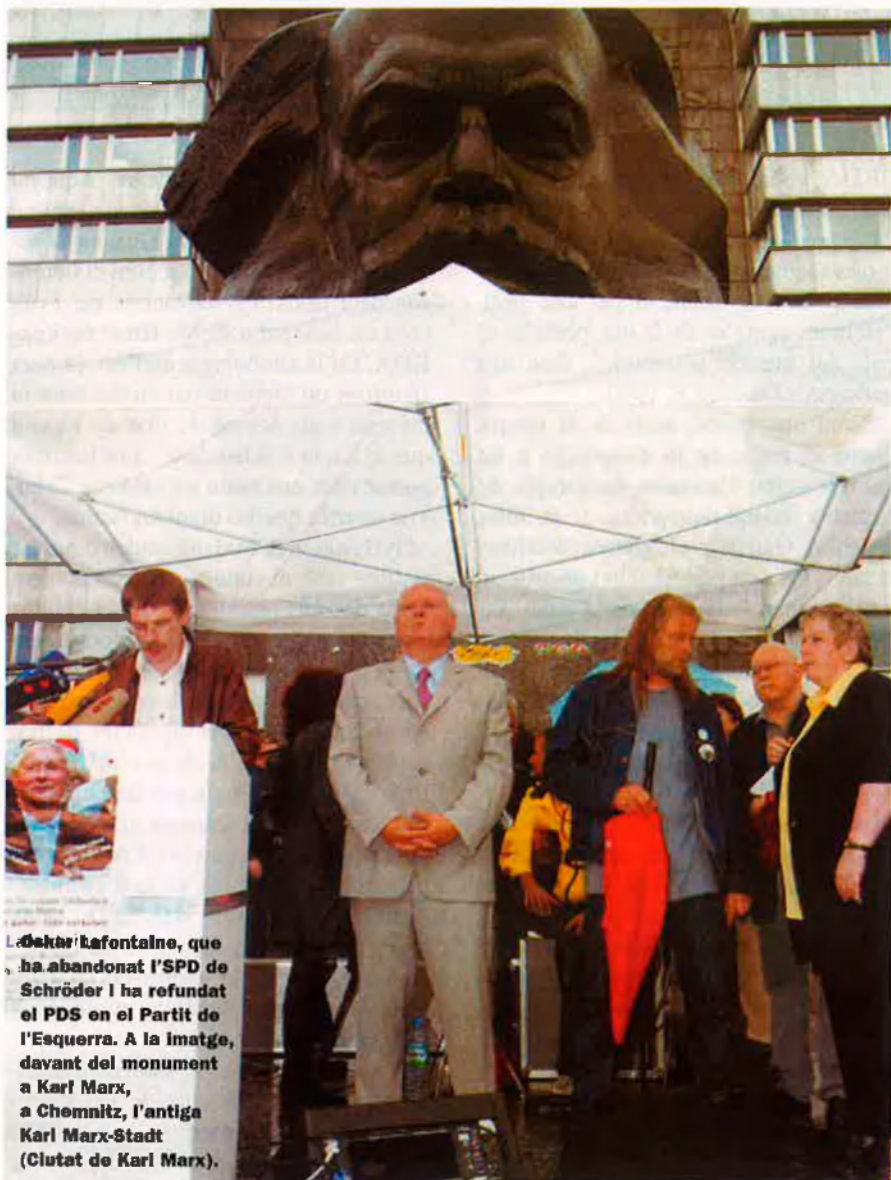
L'alemany Lafontaine, que ha abandonat l'SPD de Schröder i ha refundat el PDS en el Partit de l'Esquerra. A la imatge, davant del monument a Karl Marx, a Chemnitz, l'antiga Karl Marx-Stadt (Ciutat de Karl Marx).

Del salvador Marx al salvador Kohl. "Un desànim general", afirma