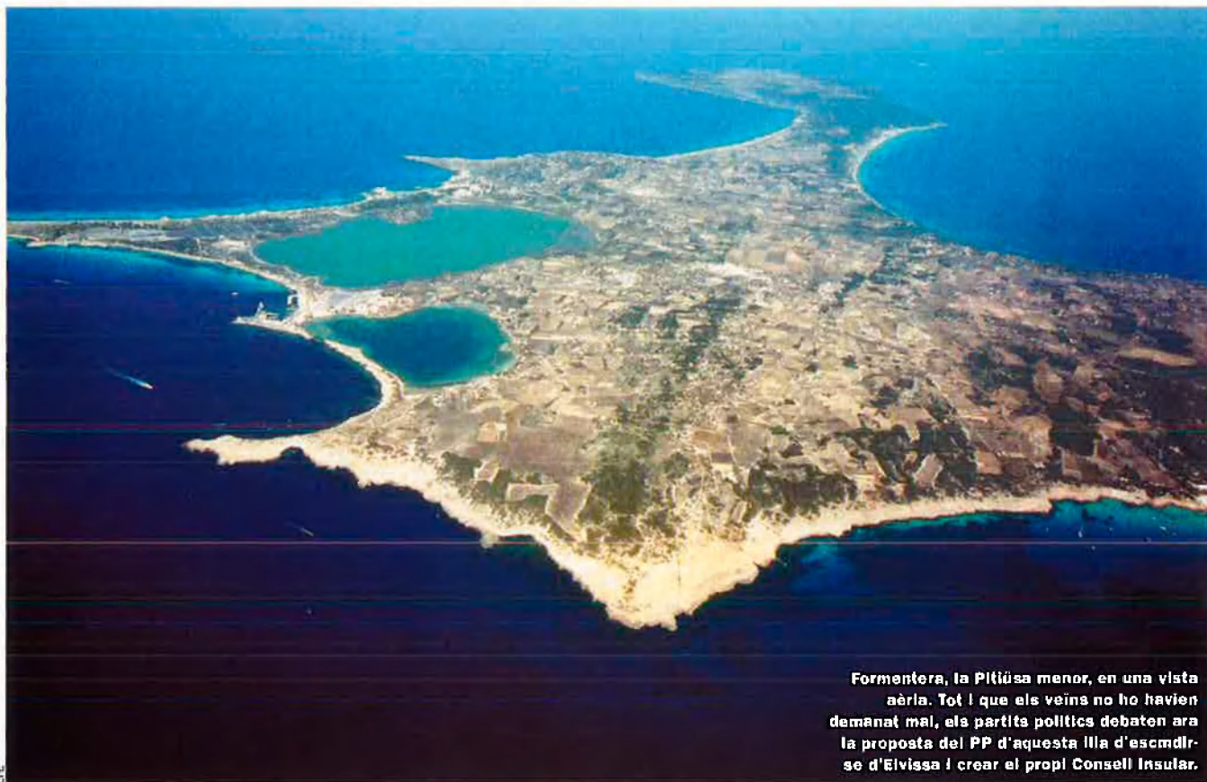
Formentera, la Pitiusa menor, en una vista aèria. Tot i que els veïns no ho havien demanat mai, els partits polítics debaten ara la proposta del PP d'aquesta illa d'escindir-se d'Eivissa i crear el propi Consell Insular.