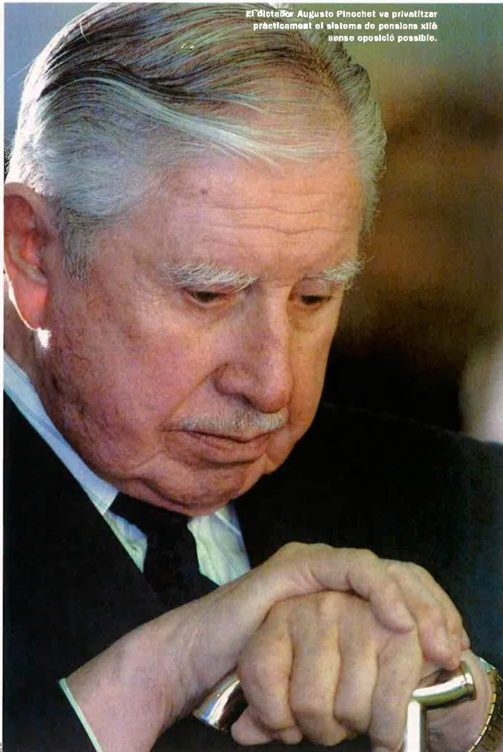
El dictador Augusto Pinochet va privatitzar pràcticament el sistema de pensions xilè sense oposició possible.

Però no tot són flors i violes i no tots, ni de bon tros, tenen en Pinochet l'exemple. El diputat assenyala que els governs democràtics "han mantingut" les polítiques del govern militar. Una afirmació que, segons els analistes, no és exactament certa. Només cal mirar els nivells de pobresa del 1987 i els actuals per observar que els executius de la Concertació (aliança de socialistes i democristians) ho han fet millor. Fa vint anys, el 45% dels xilens eren pobres; avui el nombre s'ha reduït fins al 20%, tot fent del país sud-americà l'únic de la regió que ja ha aconseguit l'objectiu del mil·lenni de l'ONU de reduir la pobresa a la meitat abans del 2015. L'exministre d'Economia del Govern de Patricio Aylwin (1990-95), Carlos Ominami, apunta que els governs elegits anteriors a Pinochet van començar el camí, gràcies sobretot a una reforma agrària i a l'eliminació del latifundi. Dos elements que fan impossible el creixement i que al Brasil, per exemple, dificulten enormement la pau social imprescindible per al desenvolupament. "Pinochet va heretar un país amb una tremenda convulsió so-