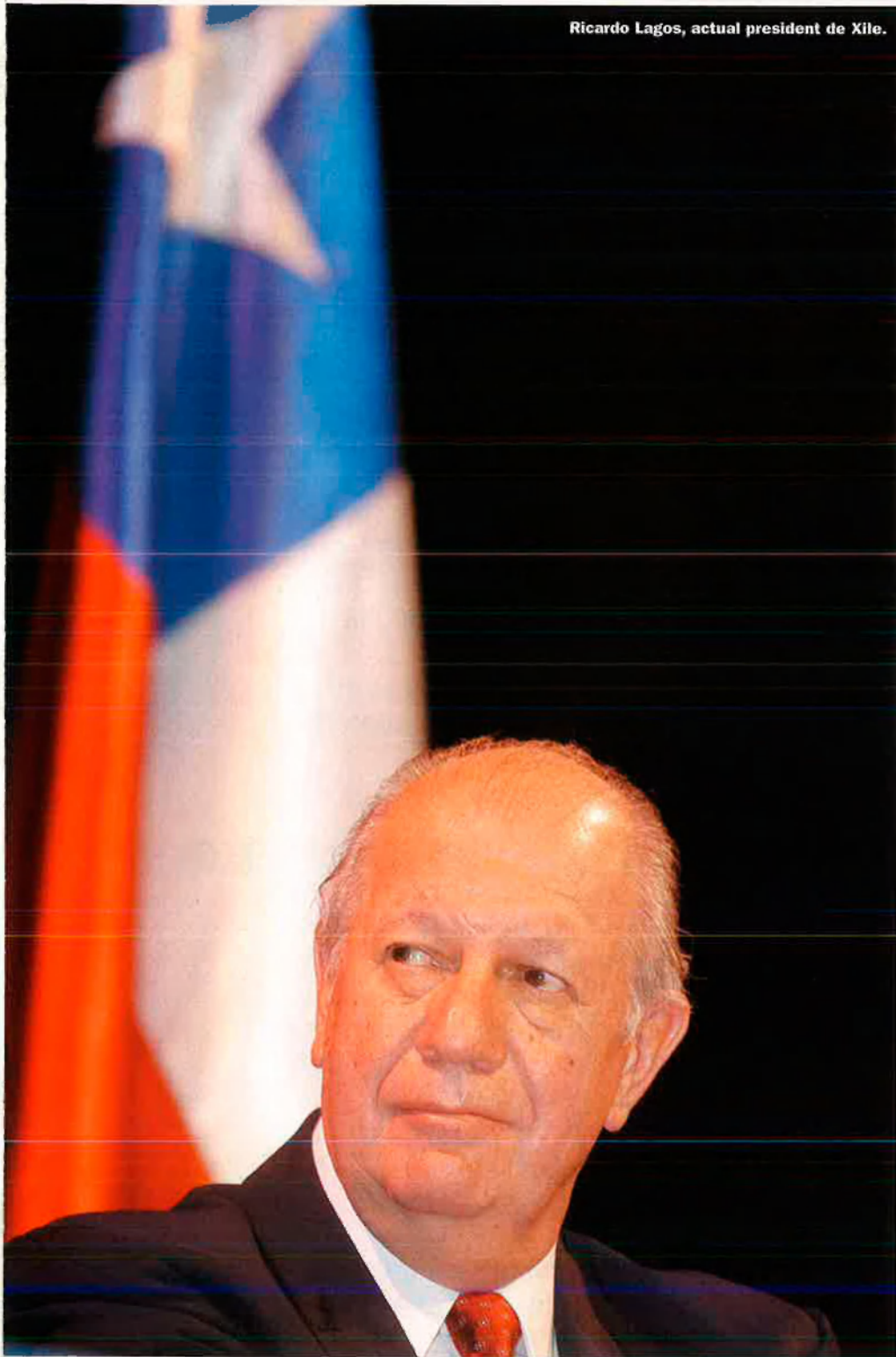
Ricardo Lagos, actual president de Xile.

La Concertació ha posat seny al liberalisme, tot invertint molt en educació