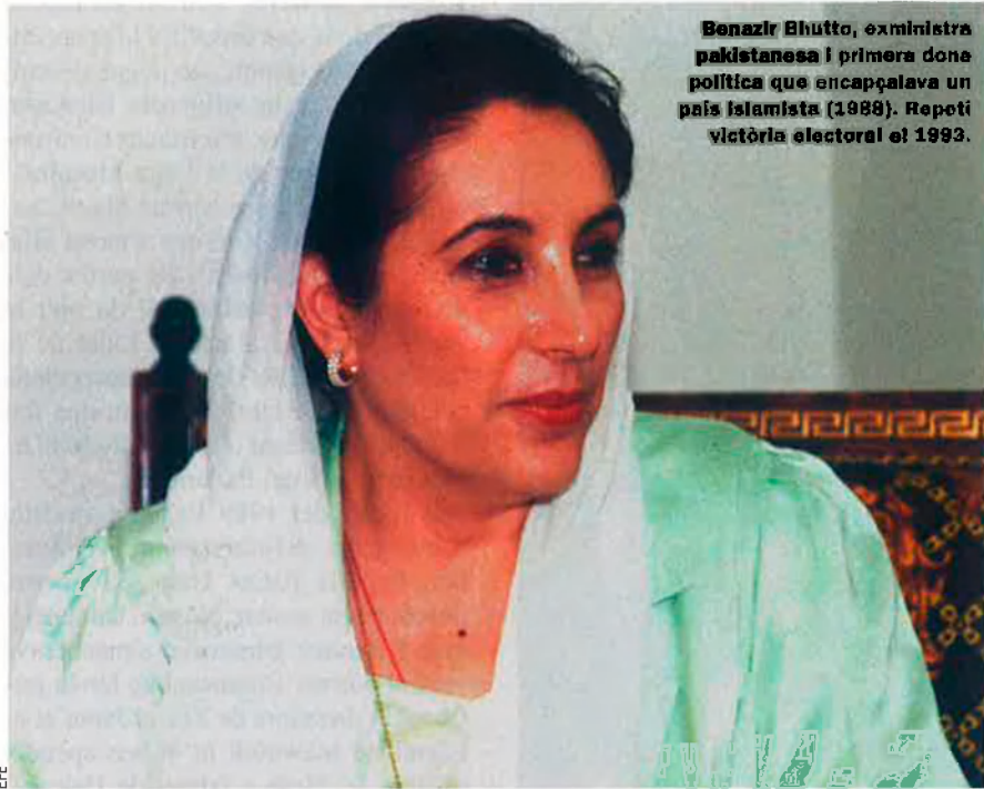
Benazir Bhutto, exministra pakistanesa i primera dona política que encapçalava un país islamista (1988). Repeti victòria electoral el 1993.

A partir del 1979, el Pakistan evolucionà cap a una dictadura islamista, amb un codi penal amb càstigs corporals