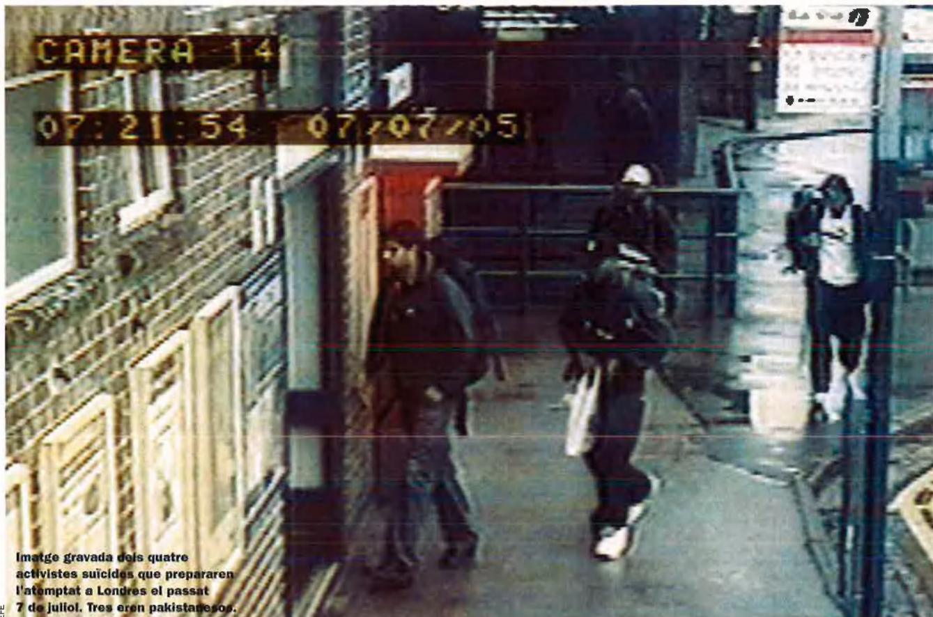
Imatge gravada dels quatre activistes suicides que prepararen l'atemptat a Londres el passat 7 de juliol. Tres eren pakistanesos.

va Delhi. Des de la fundació del Pakistan, diversos partits confessionals es disputaven l'hegemonia al nou estat i pressionaven per islamitzar l'estat. A més de la Jama'at-e Islami de Mawdudi, es constituïren dos partits d'ulemes, cas únic en el món islàmic de formacions polítiques que vetllen per aquest grup social i professional. Aquests eren el Jami'at-i Ulama-i Islam (JUI), és a dir, la "Germandat dels Ulemes de l'Islam", d'ideologia relacionada amb el moviment deobandí —que temps a venir donaria lloc als talibans— citat més amunt i amb elements del wahabisme saudita, i el Jami'at-i Ulama-i Pakistan (JUP) o "Germandat dels Ulemes de Pakistan", on militaven els ulemes més tolerants amb l'espiritualitat popular i el culte als sants.