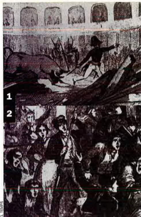
L'any 1835, en plena rebel·lió carlista, la situació era tan tensa que una simple anècdota taurina va desencadenar una revolta popular, com expliquen aquests gravats de l'època. 1. El poble protesta per la mala qualitat d'uns braus a la plaça de la Barceloneta. 2. Durant la bullanga és assassinat el general Bassa. 3. Grups d'exaltats assalten i calen foc als convents. 4. Crema de la fàbrica do Bonaplata.

Aquell sentiment anticlerical responia a la convicció popular que el cler-