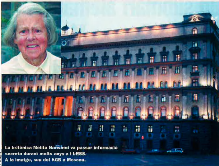
La britànica Melita Norwood va passar informació secreta durant molts anys a l'URSS. A la imatge, seu del KGB a Moscou.

Se'n va anar definitivament com ho havia fet tot sempre, amb molta discreció. Un bon dia, els seus veïns d'aquell tranquil carrer de Bexleyheath (Gran Bretanya), la van deixar de veure regant els geranis del seu petit jardí, i prou. Melita Norwood, l'espia britànica més coneguda, reclutada pel KGB amb el nom co-