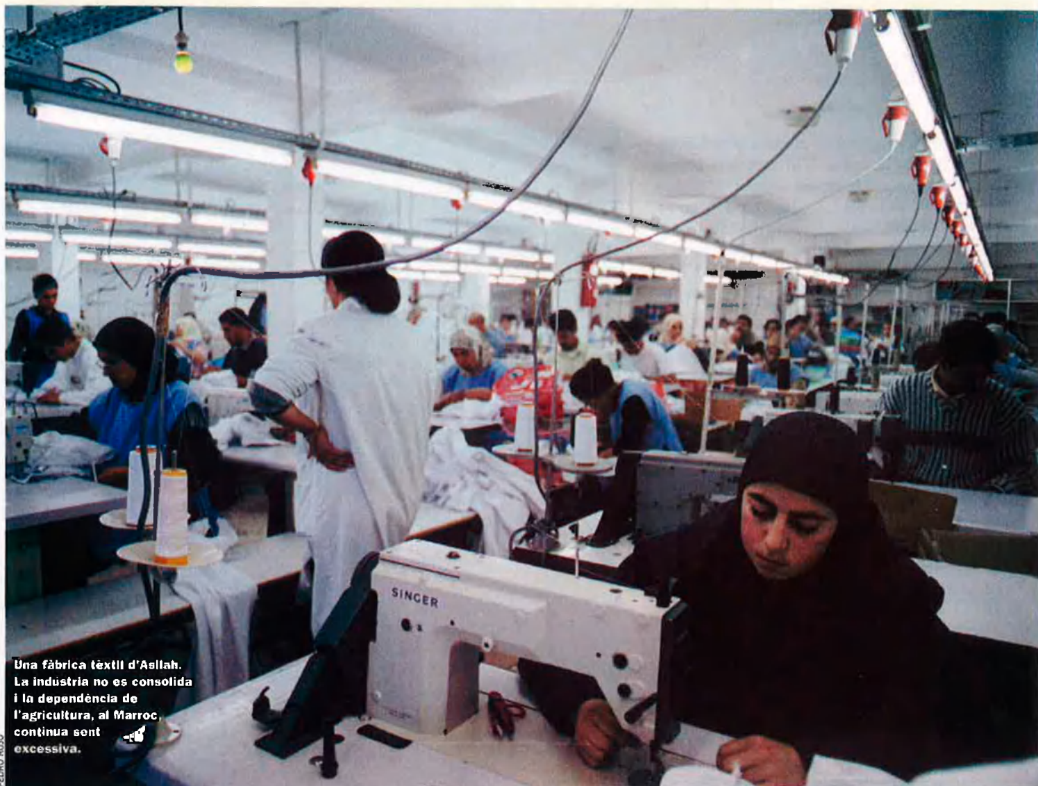
Una fàbrica tèxtil d'Asilah. La indústria no es consolida i la dependència de l'agricultura, al Marroc, continua sent excessiva.