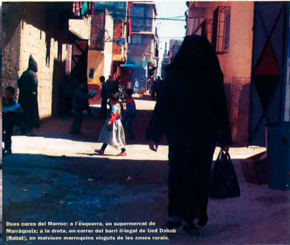
Dues cares del Marroc: a l'esquerra, un supermercat de Marràqueix; a la dreta, un carrer del barri il·legal de Ued Dahab (Rabat), on malviuen marroquins vinguts de les zones rurals.

sola cultura marroquina. Una clara mostra n'és el Festival Timitar, que a principi d'aquest mes de juliol ha organitzat la seva segona edició a Agadir (600 quilòmetres al sud de Casablanca), en què la principal reivindicació és el respecte i el coneixement a la identitat berber.