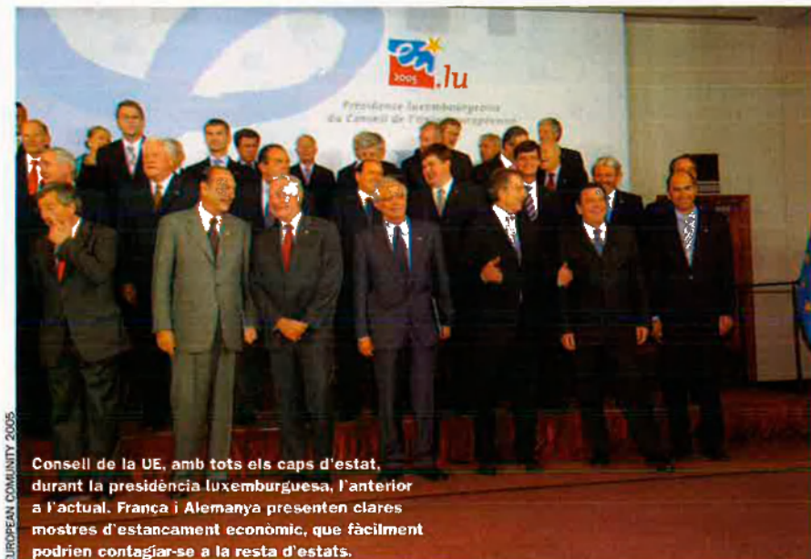
Consell de la UE, amb tots els caps d'estat, durant la presidència luxemburguesa, l'anterior a l'actual. França i Alemanya presenten clares mostres d'estancament econòmic, que fàcilment podrien contagiar-se a la resta d'estats.