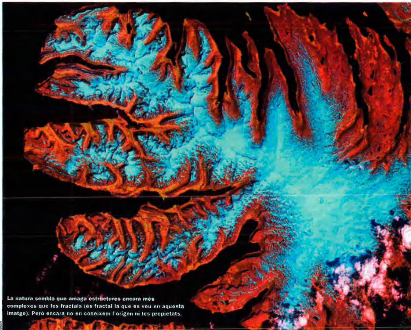
La natura sembla que amaga estructures encara més complexes que les fractals (és fractal la que es veu en aquesta imatge). Però encara no en coneixem l'origen ni les propietats.

teressant organització. La natura ens ofereix un laberint que, dins de la seva complexitat i riquesa, és moltes vegades un laberint fractal. És aquesta atraient nova visió de la geometria, i fins i tot del món en general, la que ha fet que molts investigadors s'interessin per aquest camp i que l'estudi de sistemes amb característiques fractals s'hagi convertit en les dues últimes dècades en un dels temes més recurrents en la producció científica.