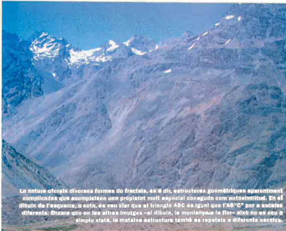
La natura ofereix diverses formes de fractals, és a dir, estructures geomètriques aparentment complicades que acompleixen una propietat molt especial coneguda com autosimilitud. En el dibuix de l'esquerra, a sota, és veu clar que el triangle ABC és igual que l'AB 2 C 2 per a aquestes diferents. Encara que en les altres imatges –el dibuix, la muntanya o la flor– això no es veu a simple vista, la mateixa estructura també es repeteix a diferents escales.