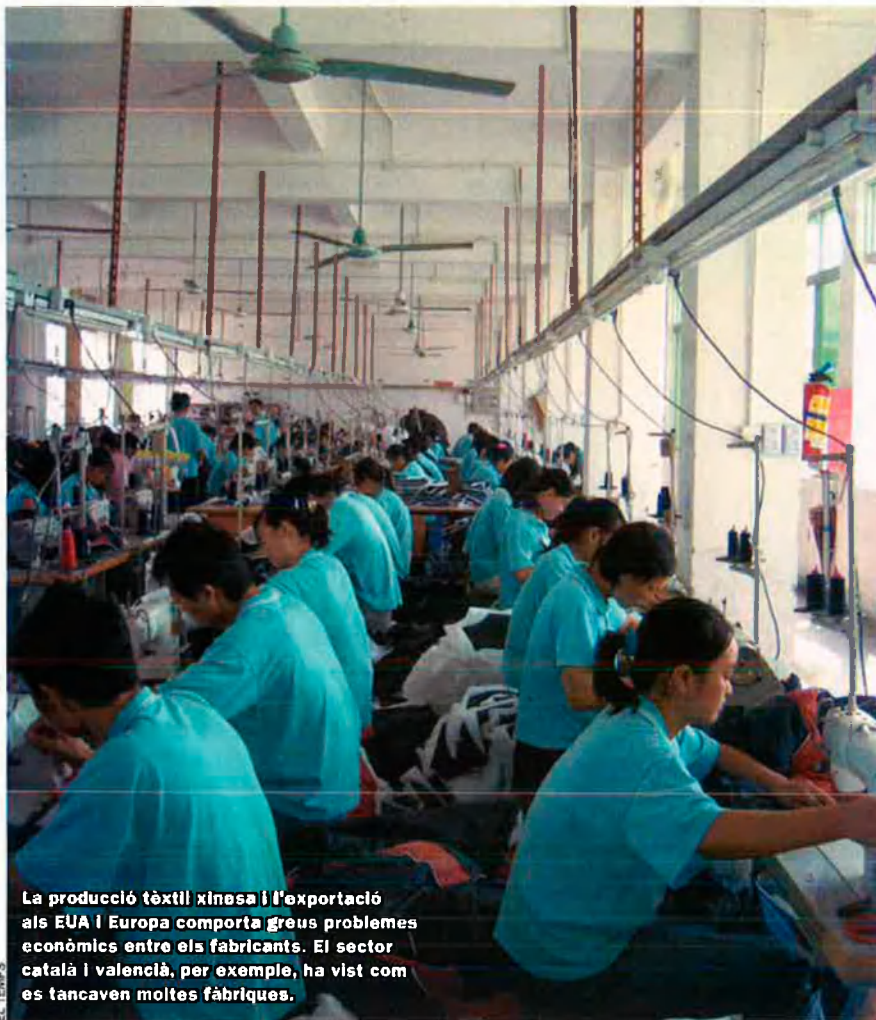
La producció tèxtil xinesa i l'exportació als EUA i Europa comporta greus problemes econòmics entre els fabricants. El sector català i valencià, per exemple, ha vist com es tancaven moltes fàbriques.

de les Tres Gorges, que amb una alçària de 170 m es preveu que produirà l'energia equivalent a 18 centrals nuclears en funcionament. L'impacte ambiental i en la població que viu prop del riu Yangzi ha despertat moltes veus crítiques.