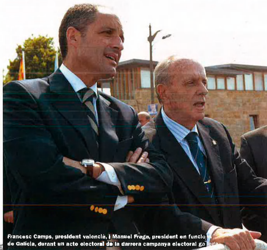
Francesc Camps, president valencià, i Manuel Fraga, president en funció de Galícia, durant un acte electoral de la darrera campanya electoral gallega.

És possible la derrota dels populars a les eleccions autonòmiques del 2007? Algunes enquestes apunten per aquest camí. En desvelem les claus.