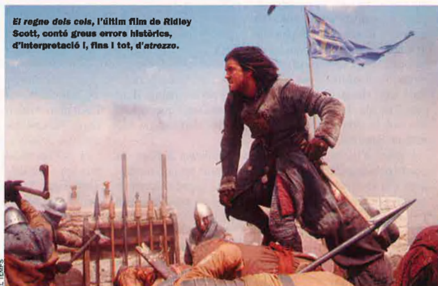
El regne dels cels, l'últim film de Ridley Scott, conté greus errors històrics, d'interpretació i, fins i tot, d'atrezzo.