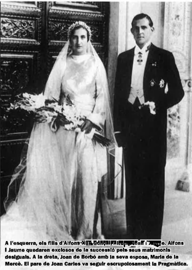
A l'esquerra, els fills d'Alfons XIII, d'Arnau, d'Alfonso i de Jaume. Alfons i Jaume quedaren exclosos de la successió pels seus matrimonis desiguals. A la dreta, Joan de Borbó amb la seva esposa, Maria de la Mercè. El pare de Joan Carles va seguir escrupolosament la Pragmàtica.