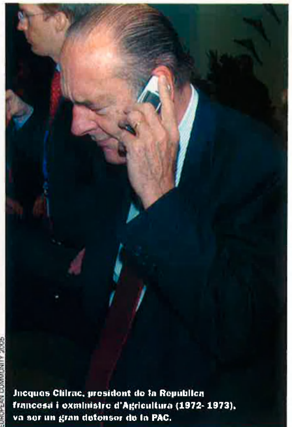
Jacques Chirac, president de la República francesa i exministre d'Agricultura (1972-1973), va ser un gran defensor de la PAC.

nent exportador. Aquest acord data del Tractat de Roma i en aquell moment Gran Bretanya no formava part de la UE o, més ben dit, de la CEE (Comunitat Econòmica Europea o Mercat Comú). Encara és més, els britànics, que fa més d'un segle que s'alimenten gràcies a les colònies o antigues colònies de la Commonwealth, no han volgut, en canvi, que es posés un “sostre” a les subvencions comunitàries agrícoles. La Comissió va proposar que el pressupost màxim per explotació no pogués superar els 300.000 euros, però els alemanys –que han de modernitzar les velles granges col·lectives de l'est– i els britànics no ho van acceptar, encara que París sí que hi estava d'acord. Per què Blair, el 2003, no va voler saber res d'aquest canvi? Senzillament perquè, si bé es cert que només són 100.000 els pagesos o ramaders britànics beneficia-