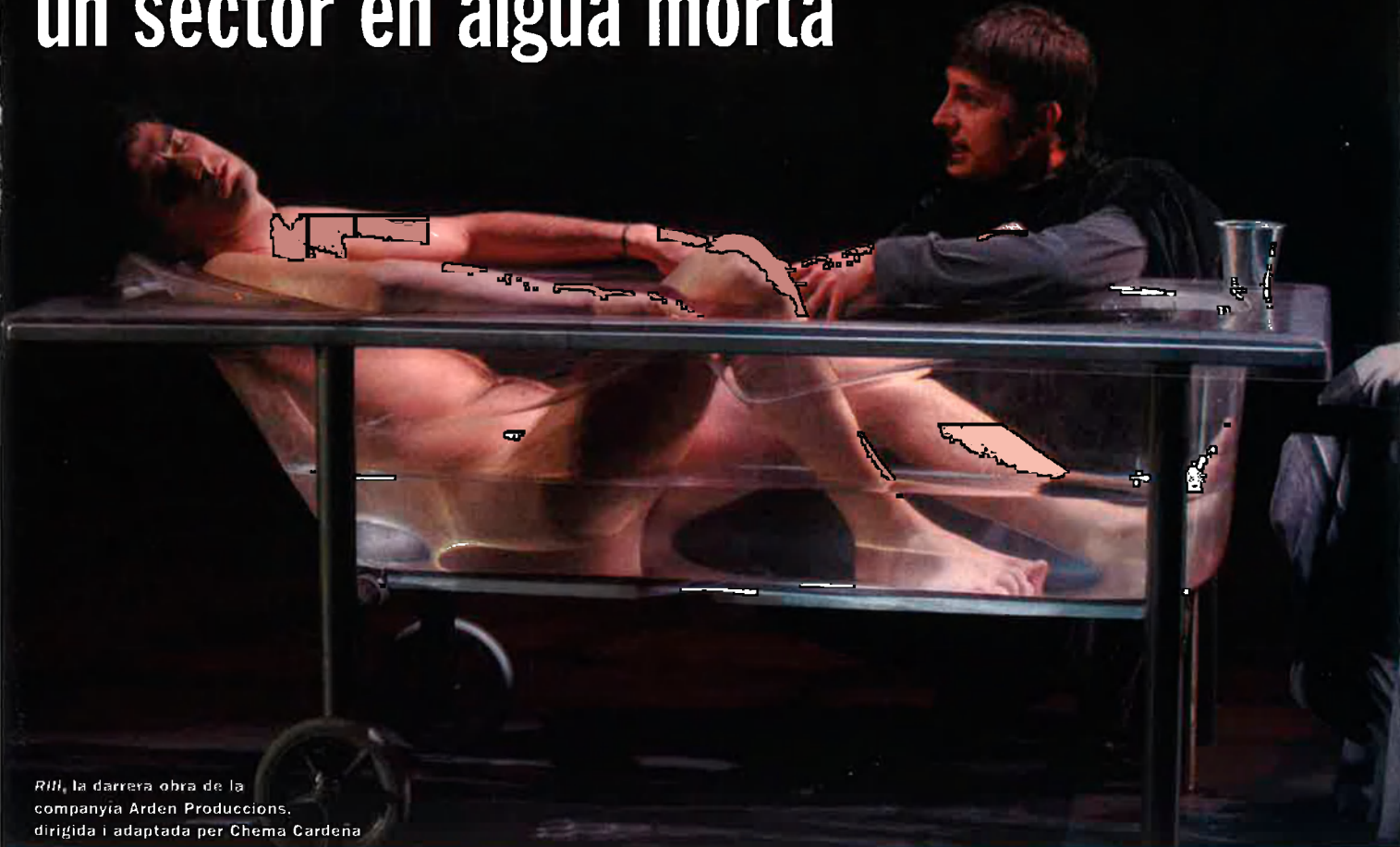
RIII , la darrera obra de la companyia Arden Produccions, dirigida i adaptada per Chema Cardena