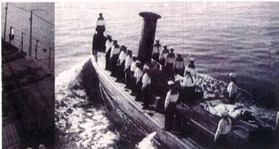
Imatges corresponents a fotogrames de la pel·lícula El cuirassat Potemkin , del director de cinema rus Sergel Eisenstein, una pel·lícula estrenada el 1924 i que és considerada una de les obres mestres de la història del cinema a nivell mundial.

moneda comuna durant els primers mesos de l'any 1905. En aquest context, el Potemkin, en la confiança que la insurrecció s'estendria a tota la flota de la mar Negra, va decidir adreçar-se cap a Odessa, que des de feia uns dies vivia en una autèntica situació revolucionària, amb una vaga general que enfrontava els obrers amb les autoritats.