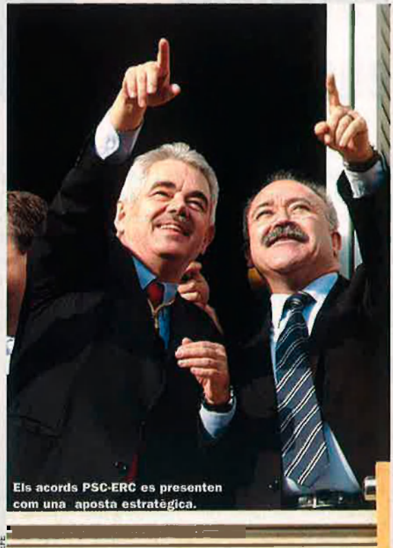
Els acords PSC-ERC es presenten com una aposta estratègica.

També en el món de l'empresa no manca qui és capaç d'omplir-se la boca amb aquesta expressió del dimoni: “Benvolguts accionistes, invertir a Sud-amèrica és la gran aposta estratègica de la companyia.” I els accionistes resten contents i enganysats. Potser és perquè molts directius i molts polítics i molts venedors han descobert l'estratègia divulgada en llibres d'aquells en què s'expliquen obvietats colossals mitjançant faules del formatge, de les set revelacions, del guerrer-monjo i d'altres collonades que alguns paguen molt cares. Fins i tot un modista és capaç de dir coses com “aquest proper hivern la nostra