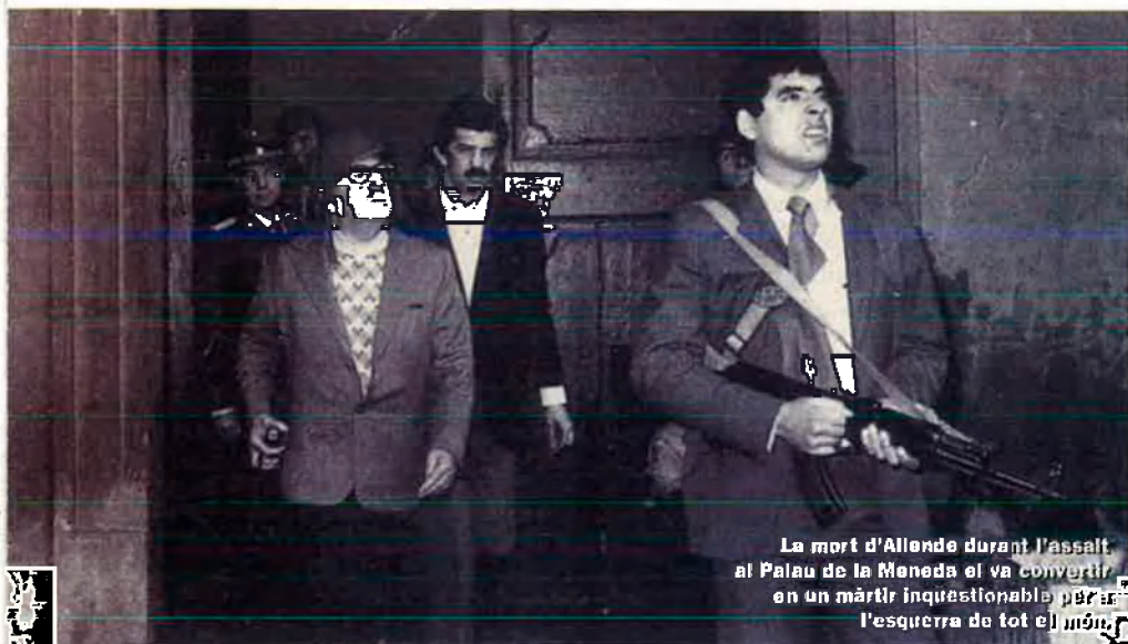
La mort d'Allende durant l'assalt al Palau de la Moneda el va convertir en un màrtir inquestionable per a l'esquerra de tot el món.

Autors nord-americans com Edwin Black ( La guerra contra els febles ) des-