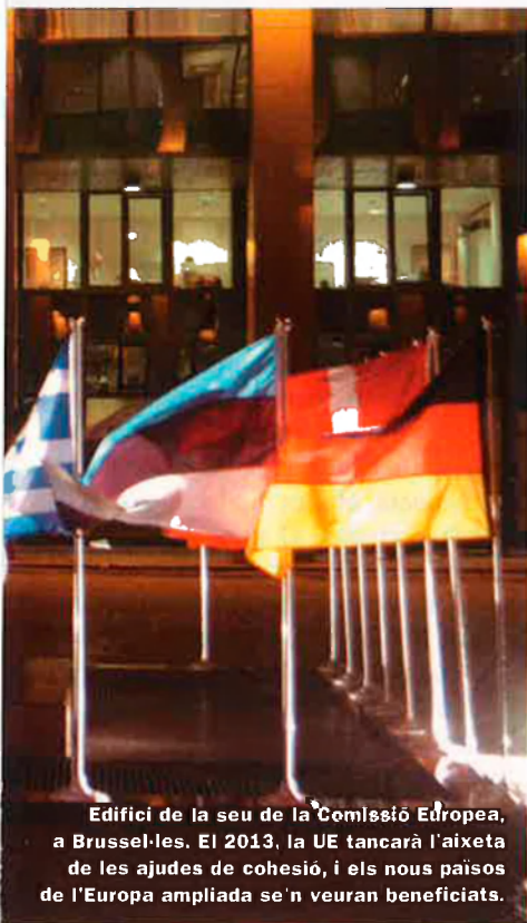
Edifici de la seu de la Comissió Europea, a Brussel·les. El 2013, la UE tancarà l'aixeta de les ajudes de cohesió, i els nous països de l'Europa ampliada se'n veuran beneficiats.

Per a Balears, les engrunes. Respecte a les intervencions a les Illes Balears, l'escala de les ajudes per projecte es molt més modesta que en els casos del País Valencià i Catalunya. Els projectes amb un cost més elevat han estat aquells relacionats amb el tractament d'aigües. En destaca el tractament terciari a Bendinat, Calvià, el qual ha comptat amb 2 milions d'euros de subvenció europea. La construcció de l'estació depuradora d'aigües residuals des Migjorn Gran va requerir d'1 milió d'euros. Dins el capítol Xarxes de comunicació i energia, s'ha fet la remodelació d'estacions de tren, les quals han gaudit d'ajuts que cobreixen fins a un 30% del cost total de les obres. És el cas de l'estació de Manacor, que va