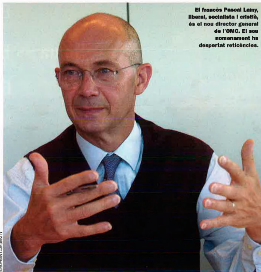
El francès Pascal Lamy, liberal, socialista i cristià, és el nou director general de l'OMC. El seu nomenament ha despertat reticències.

càrrecs del país, tant en l'esfera política com econòmica. Entre el 1975 i el 1981 treballa a la inspecció de finances i als serveis de la Direcció del Tresor. Però el 1981 Mitterrand guanya les eleccions i el ministre d'Economia i Finances, un tal Jacques Delors, s'envolta de catòlics progressistes. Lamy