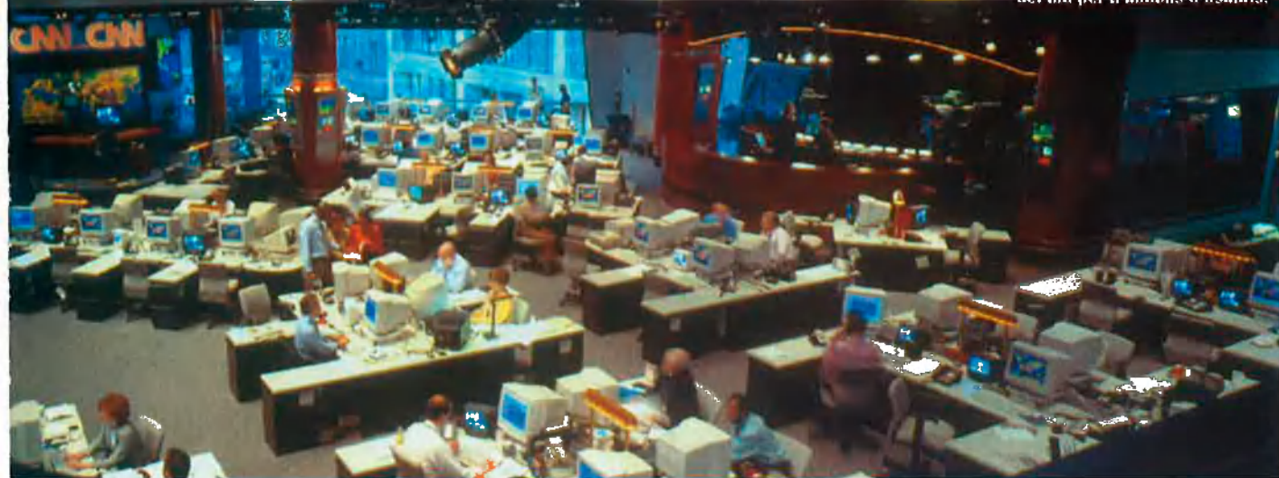
Imatge general de la redacció de la CNN a Atlanta, des d'on es produeix informació contínua les 24 hores del dia per a milions d'usuaris.