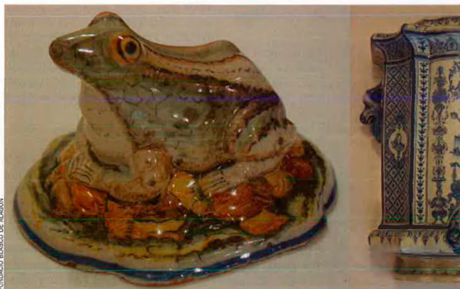
FUNDACIÓ BLASCO DE ALAGÓN

L’exposició, fruit de la bona entesa que es va produir entre la Fundació Blasco de Alagón —organitzadora de la mostra— i la institució americana amb motiu de l’exposició “La memòria daurada” (Morella, 2003), mostrarà les peces més espectaculars de la col·lecció de la Hispanic Society, recorrent tots els estils que van sortir dels tallers de l’Alcora des de la seua creació: barroc, rococó i clàssic, bàsicament. Des-