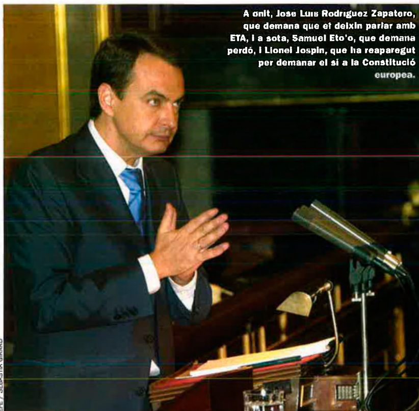
A dalt, Jose Luis Rodríguez Zapatero, que demana que el deixin parlar amb ETA, i a sota, Samuel Eto'o, que demana perdó, i Lionel Jospin, que ha reaparegut per demanar el sí a la Constitució europea.

Sort que el flanc valencià està ben cobert. Dimarts, Francesc Camps va visitar la Moncloa per dir a Zapatero que està d'acord que el sistema de finançament autonòmic ha de ser multilateral i que la reforma de l'Estatut valencià no ha d'afectar cap llei estatal. Abraçada. Rosa Estaràs, vicepresidenta del Govern balear, i Joan Saura, conseller de Relacions