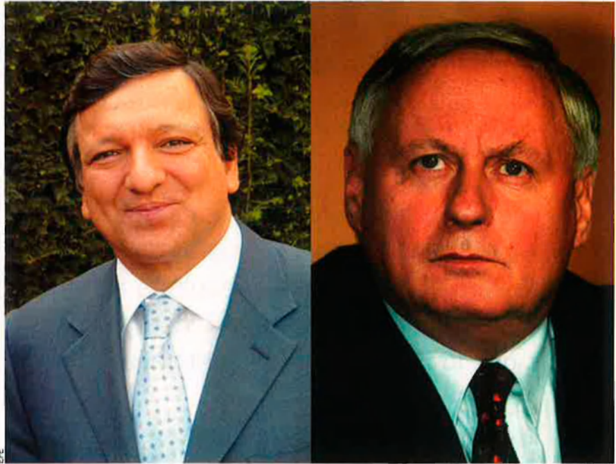
A l'esquerra, el president de la Comissió Europea, José Manuel Durao Barroso. A la dreta, Oskar Lafontaine, que pensa que un no pot reorientar la política neoliberal de la UE.

Deixar transcórrer el període dels referèndums, que encara ha de durar un any més, podria ser una manera de guanyar temps, però al final, el problema continuaria sense resoldre's. Fins i tot en el cas molt improbable que tots