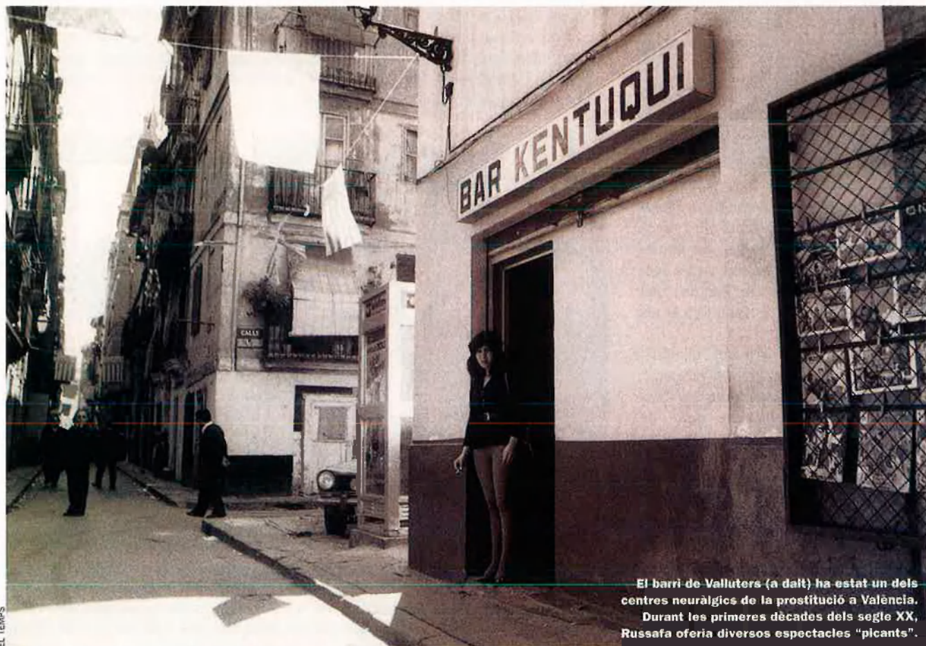
El barri de Valluters (a dalt) ha estat un dels centres neuràlgics de la prostitució a València. Durant les primeres dècades del segle XX, Russafa ofería diversos espectacles "picants".

C om es concep un llibre com La Valencia prohibida ? Segons l'autor, és una idea que cobra forma a mesura que hom aprofundeix en la lectura de la història de la ciutat i s'adona que falta una part, que no pot ser ignorada perquè implica un sector de la societat major del que es pensa. La història de València serà parcial fins que no es faça ressò d'aquells altres relats, els marginals, els que es conten a cau d'orella i que, en no trobar ningú amb valor suficient per plasmar-los en