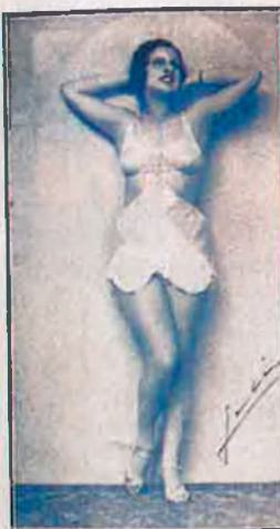
en la obra