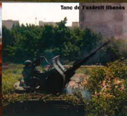
Tanc de l'exèrcit libanès

trobés a faltar. Hi deixen els milicians d'Hezbollah, un incompliment parcial de les resolucions de les Nacions Unides en una zona on costa veure el contrari.