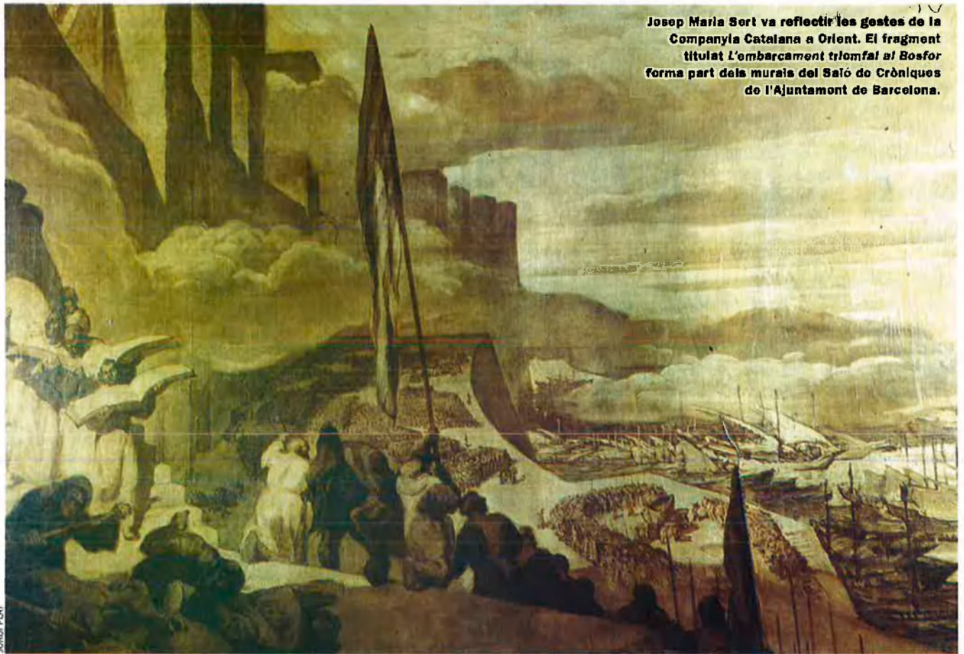
Josep Maria Sert va reflectir les gestes de la Companyia Catalana a Orient. El fragment titulat L'embarcament triomfal al Bosfor forma part dels murals del Saló de Cròniques de l'Ajuntament de Barcelona.