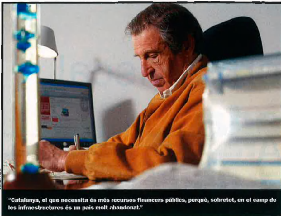
"Catalunya, el que necessita és més recursos financers públics, perquè, sobretot, en el camp de les infraestructures és un país molt abandonat."

té oficina, Caixa Catalunya també en té. A més a més, les caixes petites tenen una gran vinculació amb el territori, i molt difícilment la gent de la localitat acceptaria la desaparició d'allò que per a ells és un senyal d'identitat.