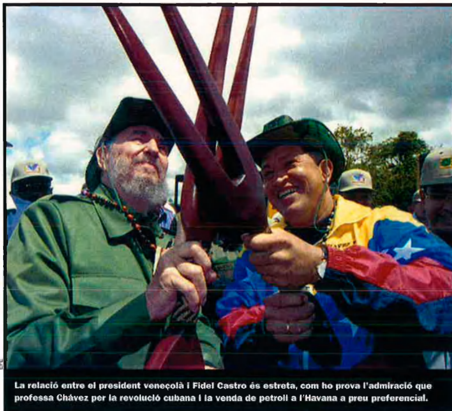
La relació entre el president veneçolà i Fidel Castro és estreta, com ho prova l'admiració que professa Chávez per la revolució cubana i la venda de petroli a l'Havana a preu preferencial.