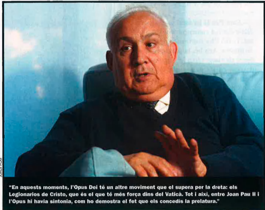
"En aquests moments, l'Opus Dei té un altre moviment que el supera per la dreta: els Legionarios de Cristo, que és el que té més força dins del Vaticà. Tot i així, entre Joan Pau II i l'Opus hi havia sintonia, com ho demostra el fet que els concedís la prelatura."