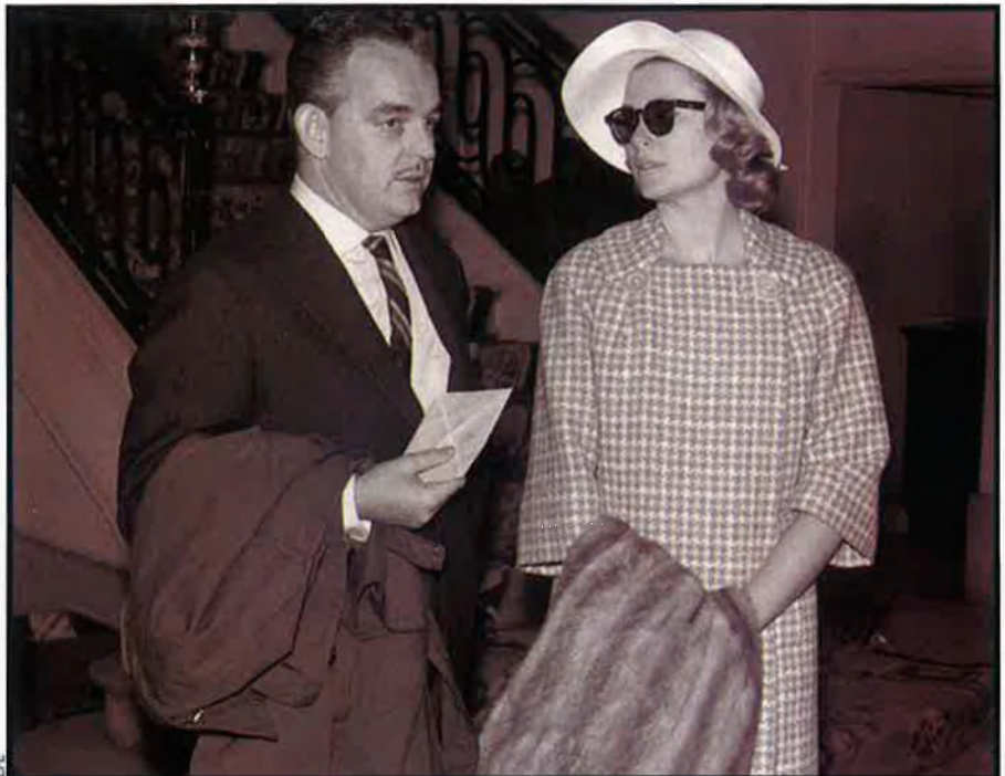
A partir de la seva boda amb l'actriu Grace Kelly, el 18 d'abril de 1956, el petit Principat de Mònaco esdevingué la pàtria europea del glamour .

Mònaco-França. Mònaco és un país sobirà en qüestions d'ordre intern i depèn de França en matèries com ara defensa, justícia i política exterior. La unió monetària data de 1861. Les rela-