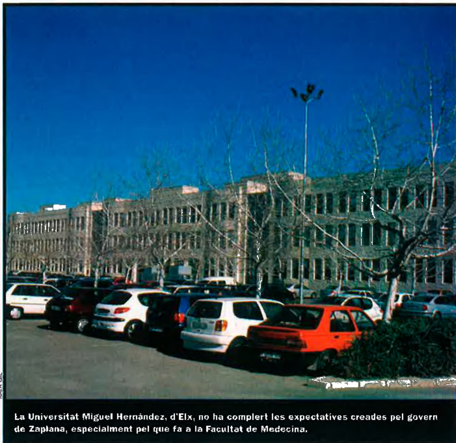
La Universitat Miguel Hernández, d'Elx, no ha complert les expectatives creades pel govern de Zaplana, especialment pel que fa a la Facultat de Medicina.