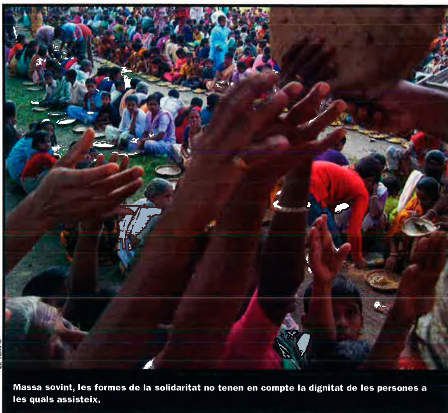
Massa sovint, les formes de la solidaritat no tenen en compte la dignitat de les persones a les quals assisteix.

cal recordar, per exemple, la persecució que establiren els anglesos, al segle XIX, envers els vaixells esclavistes estrangers: feta sota el paraigua de la moralitat i amb intenció de domini del comerç marítim—, és cert que l'anomenat “humanitarisme d'estat” es va estendre de manera espectacular sobretot arran de la caiguda del mur de Berlín. Aleshores, apunta Raich, es va “inaugurar un període de culte cínic als drets humans”. És l'època en què els estats van convertir l'impuls solidari dels seus ciutadans en instrument tant per a la