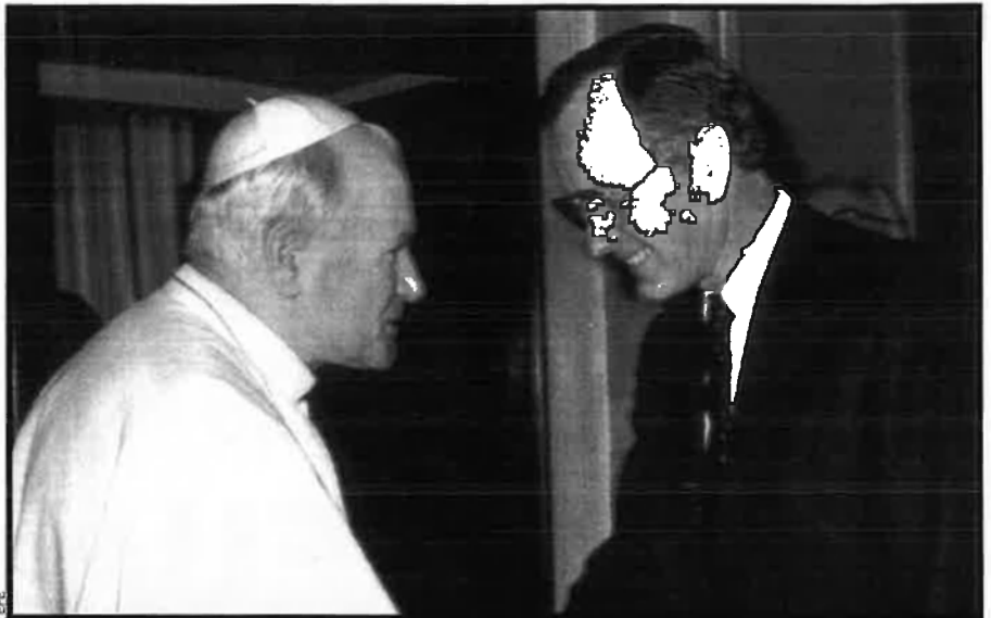
El papa dóna la benvinguda al president dels Estats Units, George Bush (pare), en una visita que aquest darrer va fer al Vaticà.

Des del punt de vista dels catòlics dels Estats Units, en canvi, el motiu de la crisi era un altre. Així, molts americans opinaven que la preocupació principal del Vaticà era mantenir el seu poder i, en conseqüència, mentre milers de nens eren agredits sexualment per capellans, la jerarquia catòlica procurava protegir-se en lloc d'acceptar els errors i preocupar-se per corregir-los. Segons John Allen, el Vaticà no va ser capaç de veure que la causa de l'escàndol va ser la mala gestió del problema pels bisbes i no els abusos sexuals en si. Un exemple n'és Bernard Law, el cardenal de Bos-