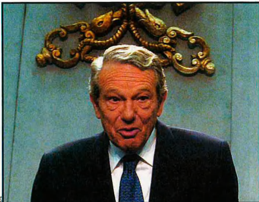
El portaveu de la Santa Seu, Joaquin Navarro Valls, ha estat un dels encarregats de comparèixer davant la premsa per explicar l'estat de salut del papa Joan Pau II.

millorar la comprensió mútua entre les dues parts i partint de fonts eclesiàstiques, les estructures i el funcionament de la cúria romana.