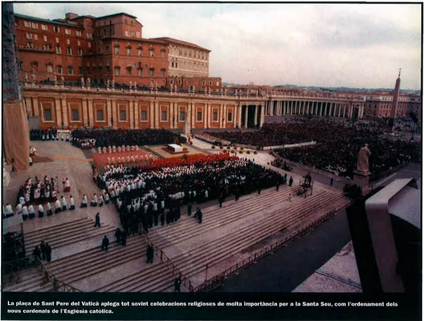
La plaça de Sant Pere del Vaticà aplega tot sovint celebracions religioses de molta importància per a la Santa Seu, com l'ordenament dels nous cardenals de l'Església catòlica.

que, segons Allen, no situa el Vaticà dins de les 500 institucions sense afany de lucre més grans del món. L'any 1993 la Santa Seu va aconseguir equilibrar els comptes, després de 23 anys de pèrdues; una situació que havia arribat a un punt culminant el 1986 amb un dèficit de 56 milions de dòlars. D'altra banda, les inversions financeres de la Santa Seu es van saldar l'any 2002 amb un dèficit de 18 milions de dòlars. Val a dir, finalment, que el patrimoni del Vaticà es pot valorar en uns 800 milions de dòlars, xifra que s'explica per què les grans obres d'art, com l'estàtua de la Pietat i la capella Sixtina de Miquel Àngel, o les pintures de Rafael, són registrades en els llibres del Vaticà a 1 euro cadascuna; un valor idèntic del de les prop de 18.000 peces d'art que posseeix la Santa Seu i que, per considerar-les tresor de la humanitat, no es poden vendre.