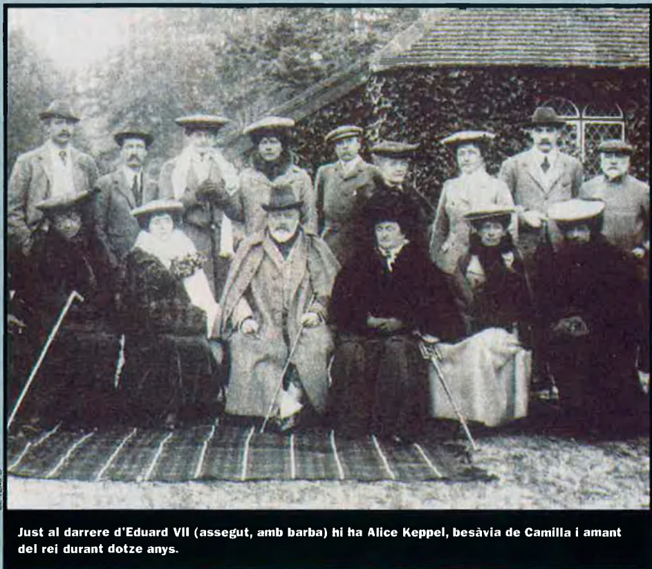
Just al darrere d'Eduard VII (assegut, amb barba) hi ha Alice Keppel, besàvia de Camilla i amant del rei durant dotze anys.

En tot l'afer Carles-Camilla, crida l'atenció que una besàvia de la pròxima muller del príncep de Gal·les fos amant d'Eduard VII. Efectivament, Camilla ho sabia i això va ser el tema de la conversa que inicià la relació de tots dos, quan durant el transcurs d'un partit de polo (esport al qual és molt afeccionat el de Gal·les) a Great Windsor Park el 1972 ella li preguntà si sabia que Eduard VII i Alice Keppel, besàvia de Camilla, havien compartit llit. L'anècdota no passaria d'aquí si la relació entre Carles i Miss Shand no hagués anat a més, però, efectivament, la bella Alice Keppel mantingué una apassionada re-