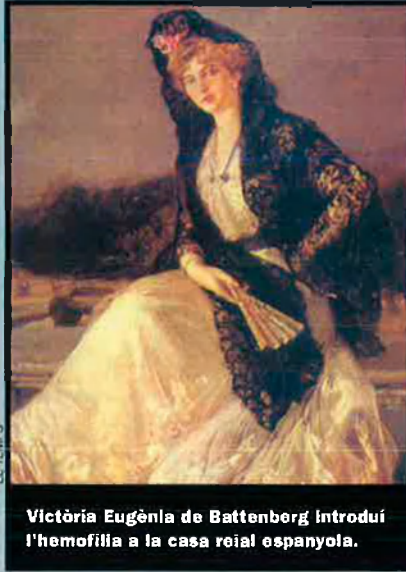
Victòria Eugènia de Battenberg introduí l'hemofília a la casa reial espanyola.

A més de tocar-se pel parentesc de Felip d'Edimburg i Sofia de Grècia, la casa reial espanyola està emparentada amb la britànica per la descendència de la reina Victòria. Alfons XIII es casà el 1906 amb Victòria Eugènia de Battenberg, néta d'aquella i filla de la princesa Beatriu i Enric de Battenberg. Nascuda al palau escocès de Balmoral el 1857, sembla que gaudí d'un especial afecte de la reina emperadriu (que ho era de l'Índia). És també la causant d'una maledicció per a la reialesa espanyola, car hi introduí la terrible hemofília. I això, malgrat que Eduard VII advertí la cort espanyola de la greu afecció de la seva germana. El matrimoni es consumà i l'hemofília afectà dos dels cinc fills mascles, el primogènit i príncep d'Astúries Alfons, que patí la malaltia durant tota la seva vida, i el menor Gonçal. El secundogènit Jaume era sord-mut, i un altre nasqué