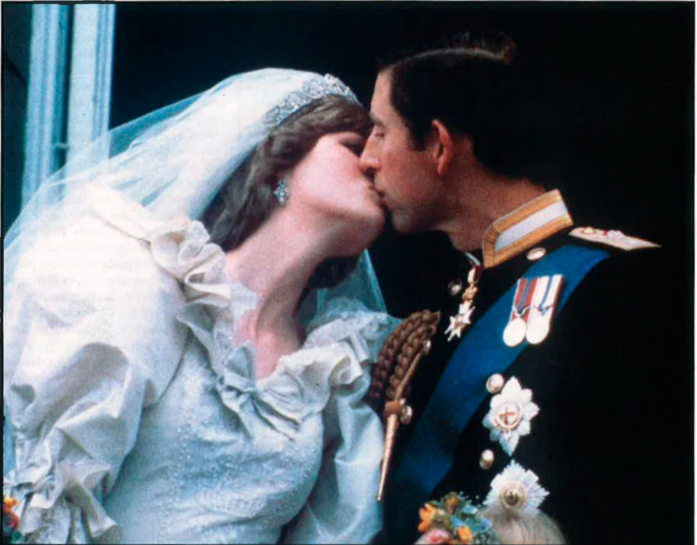
Diana Spencer i Carles d'Anglaterra es casaren l'any 1981. Aleshores tothom va coincidir a presentar l'enllaç com la conclusió d'un conte de fades. Anys després, Diana expressava públicament i amargament que el seu matrimoni era, en realitat, "un trio".

del 23 de març del 1776, que prohibeix expressament els matrimonis morganàtics o entre desiguals. Obviada per l'actual monarca, tot atenent-se a la seva condició de successor de Franco, no es pot oblidar que la Constitució de 1978 (article 57.1) hi fa esment quan diu que la successió al tron "seguirà l'ordre regular".