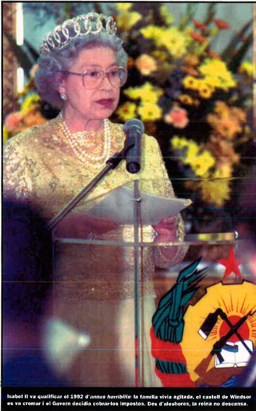
Isabel II va qualificar el 1992 d' annus horribilis : la família vivia agitada, el castell de Windsor es va cremar i el Govern decidia cobrar-los impostos. Des d'aleshores, la reina no descansa.

etc. Tanmateix, els encreuaments entre casals regnants del segle XVI ençà i la complexitat derivada, car avui regnaven