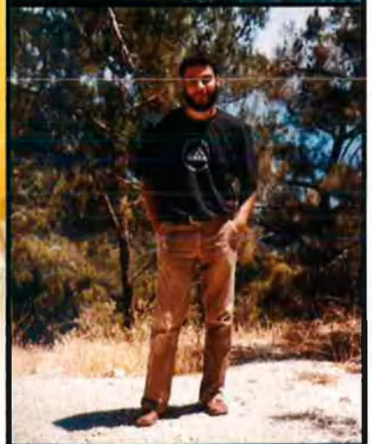
Abu Dahdah (a dalt) era el cap de la xarxa d'Al-Qaida a l'estat espanyol, sota les ordres de Abu Qutada (a sota), cap per a Europa. Ossama bin Laden (a l'esquerra) n'es el líder absolut.