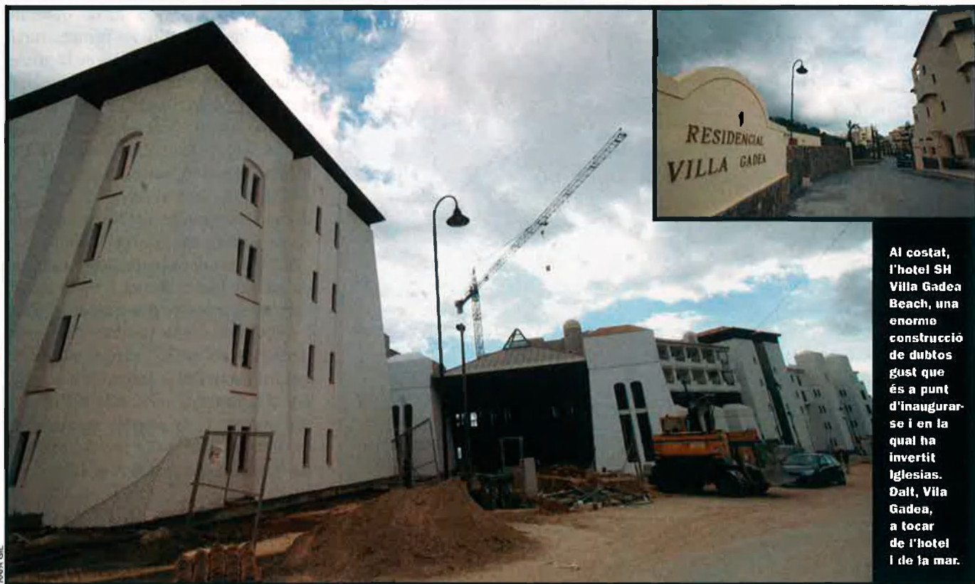
Al costat, l'hotel SH Villa Gadea Beach, una enorme construcció de dubtos gust que és a punt d'inaugurar-se i en la qual ha invertit Iglesias. Dalt, Vila Gadea, a tocar de l'hotel i de la mar.

permesa al pla general, i han previst un passeig marítim semiprivat.