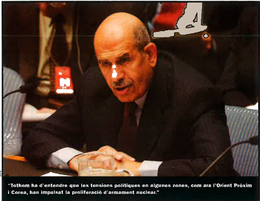
"Tothom ha d'entendre que les tensions polítiques en algunes zones, com ara l'Orient Pròxim i Corea, han impulsat la proliferació d'armament nuclear."

—Reforçar els controls de seguretat amb les inspeccions segons el protocol addicional com a norma. Castigar automàticament les vulneracions del NPT, sobretot les retirades, amb sancions del Consell de Seguretat de l'ONU. Sotmetre a control internacional el material amb què es poden fabricar armes, com l'urani enriquit o el plutoni. Tothom ha de renunciar a alguna cosa, estem entre l'espasa i la paret: la construcció de noves instal·lacions per a la producció de material de fissió s'ha de suspendre com a mínim cinc anys. Els països amb material nuclear han de garantir als pobres el subministrament de combustible nuclear per a ús civil.