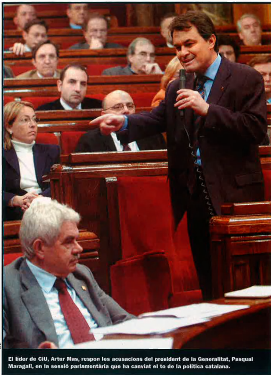
El líder de CiU, Artur Mas, respon les acusacions del president de la Generalitat, Pasqual Maragall, en la sessió parlamentària que ha canviat el to de la política catalana.

Les conseqüències. Amb aquest ambient tan tens és força difícil imaginar que els processos polítics iniciats en aquesta legislatura puguin mantenir el mateix ritme sense veure's afectats per la crisi. De moment, totes les infraestructures previstes pel govern tripartit es veuran alentides pels compromisos de revisió de la seguretat i dels processos de contractació d'obres públiques. I això només pel que fa a les conseqüències directes de la crisi del Carmel.