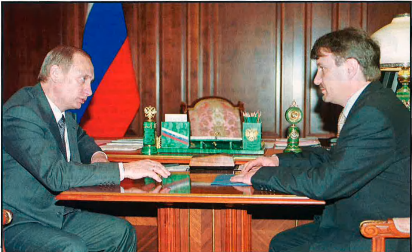
El ministre de Desenvolupament Econòmic i Comerç rus, German Gref, a la dreta, en una trobada recent amb el president rus Vladimir Putin. Gref és un dels polítics que més ha batallat per la consolidació del lliure mercat a Rússia.

amb efectes retroactius, una pràctica que ha criticat el Consell d'Europa, i en comptes, també, d'exercir pressió sobre advocats i testimonis.