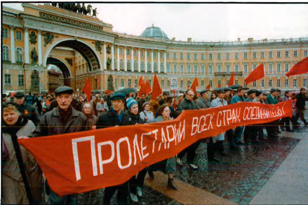
Manifestació comunista de l'1 de maig del 1999 a Sant Petersburg. A la pancarta es pot llegir "Treballadors del món, uniu-vos".