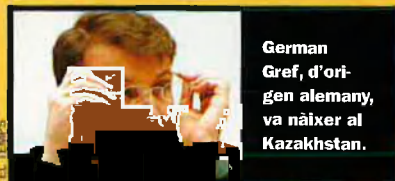
German Gref, d'origen alemany, va nàixer al Kazakhstan.

El ministre rus de Desenvolupament Econòmic i Comerç, German Gref, de quaranta-un anys, es va donar a conèixer com a defensor del lliure mercat, a la dècada dels noranta, quan bona part de la Unió Soviètica es va privatitzar. Durant aquell boom, va conèixer el futur president Vladímir Putin a Sant Petersburg. Es va traslladar a Moscou l'any 1998, on treballava per al Govern i, dos anys més tard, Putin el va triar per encapçalar un consell sobre economia russa i comerç. Gref va nàixer al Kazakhstan, perquè és allà on els seus pares, que eren alemanys, van ser enviats l'any 1941.