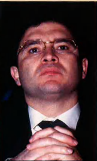
A l'esquerra, el líder de CiU, Artur Mas, que no vol que ningú posi algua al vi en les negociacions del nou Estatut i del sistema de finançament de Catalunya. A dalt, Serafín Castellano, portaveu del PP a les Corts valencianes. Els zaplanistes l'han homenatjat després d'haver abandonat la presidència provincial del partit a València.