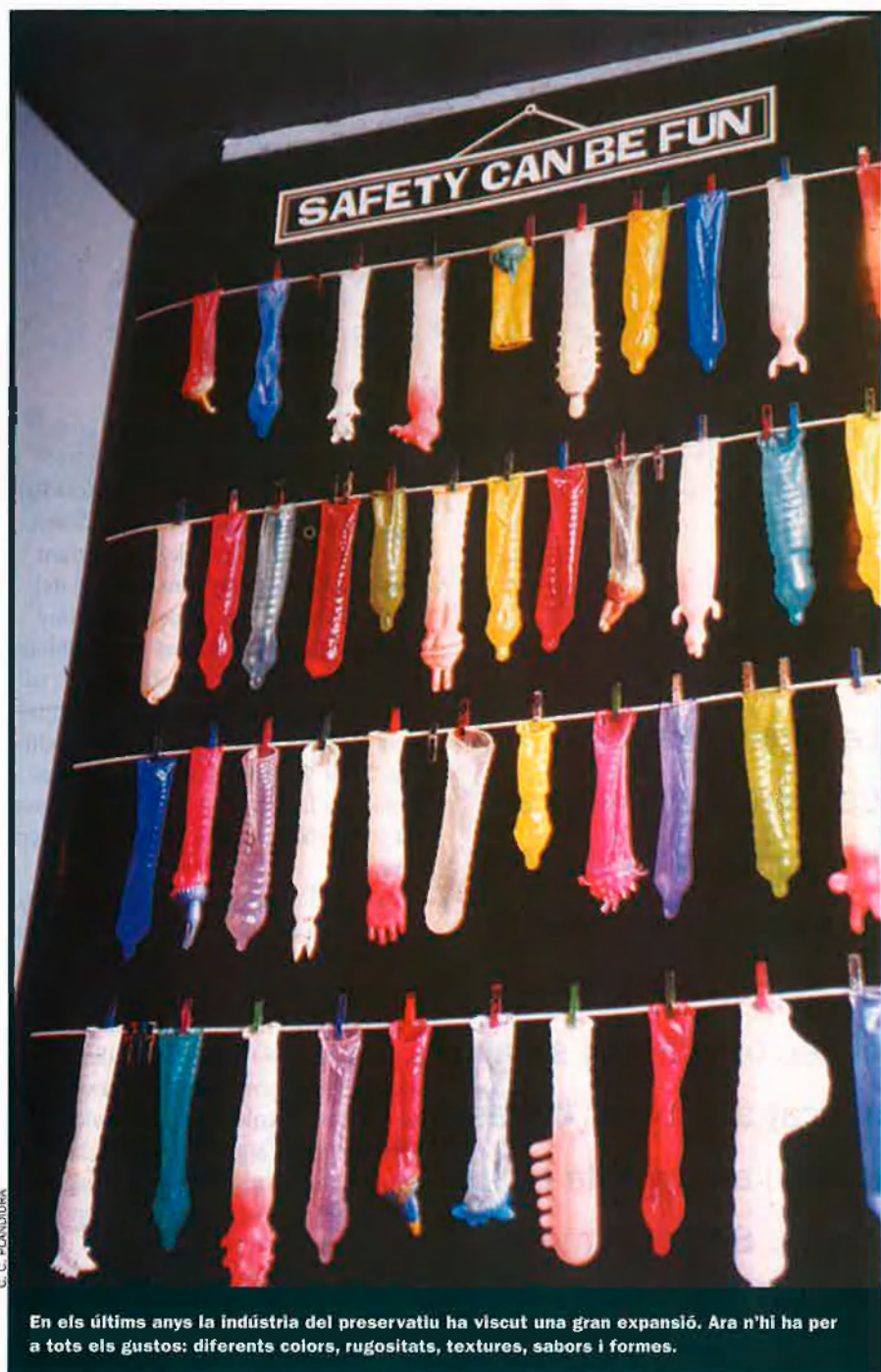
En els últims anys la indústria del preservatiu ha viscut una gran expansió. Ara n'hi ha per a tots els gustos: diferents colors, rugositats, textures, sabors i formes.

Amb condó és pecat. Malgrat el creixement de vendes i el bon moment que viuen avui dia les indústries de fabricació de condons, aquest continua sent un tema polèmic a la majoria dels països. Principalment perquè les organitzacions religioses s'han oposat tradicionalment a l'ús del preservatiu i fins i tot el posen al mateix sac que l'avortament o altres mètodes anticonceptius. L'Església catòlica ha estat molt bel·ligerant en aquest sentit, sobretot des de l'arribada de Joan Pau II al Vaticà, qui s'ha mostrat sempre com un ferm defensor de la castedat no tan sols com a remei per evitar les malalties de transmissió sexual sinó com l'únic mitjà contra els embarassos no desitjats. De fet, els religiosos dissidents, que alguna vegada s'han manifestat a favor del preservatiu com a forma de lluitar contra la sida, han estat