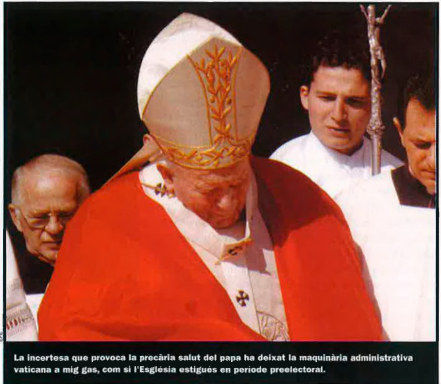
La incertesa que provoca la precària salut del papa ha deixat la maquinària administrativa vaticana a mig gas, com si l'Església estigués en període preelectoral.

Com és sabut, demanà anys enrere un altre concili, i encara ara advoca per una major col·legialitat en el govern eclesial: “El Vaticà II i Pau VI, en instituir el Sínode de Bisbes, tenien al cap una mena de consell permanent de regència de l'Església juntament amb el papa, una institució que s'ha quedat en les escapces”. Martini, però, que sap que la Bíblia i la litúrgia han d'anar de bracet, fa por a certs sectors, sobretot als de l'Opus. Seria tan compromès elegir-lo a ell com a Cipriani. Alguns el