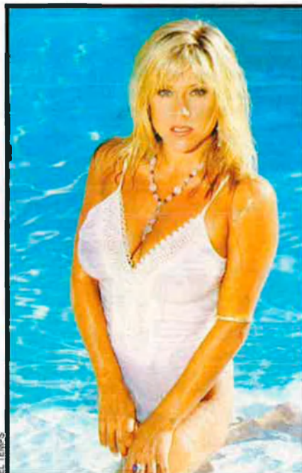
Fins i tot reinos de l'eroticisme com Samantha Fox han sucumbit als encants redemptors de l'evangelisme fonamentalista.

Però tot això és una broma al costat del que està succeint a la Xina, on, segons l'antic corresponsal de la revista Time a Pequín, David Aickman, “ja hi ha 100 milions de cristians practicants, la taxa de conversió és d'un 7% anual i es cons-