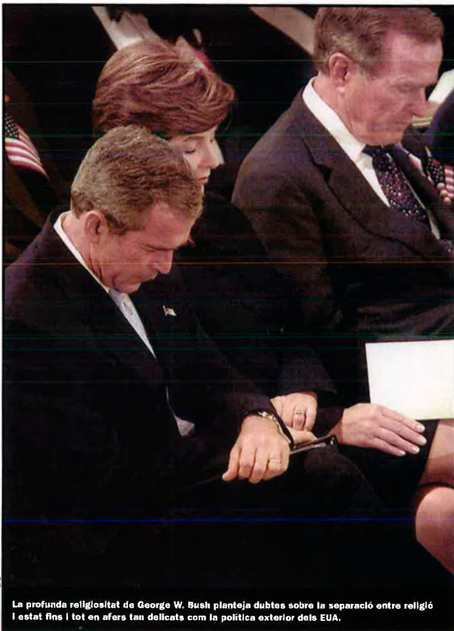
La profunda religiositat de George W. Bush planteja dubtes sobre la separació entre religió i estat fins i tot en afers tan delicats com la política exterior dels EUA.

respostes i normes de conducta que l'Església catòlica no ha estat capaç de procurar. Vicente Verdú ho explica, referint-se a la vivència religiosa americana: "La idea medieval d'un Déu perfecte davant del qual el creient es disposa passivament a orar aclaparat per la perfecció divina ha estat reemplaçada —en l'evangelisme americà— per la concepció d'un Déu capatàs que, en la construcció del seu regne, necessita els seus súbdits en forma de manobres, executius i empresaris. Honorar Déu significa millorar productivament els béns de la terra, generar riquesa, fer-se multimilionari. Els grans magnats són individus