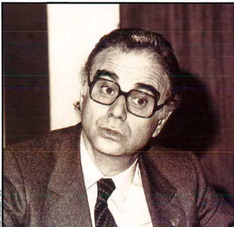
ANA TORRALBA / EFE