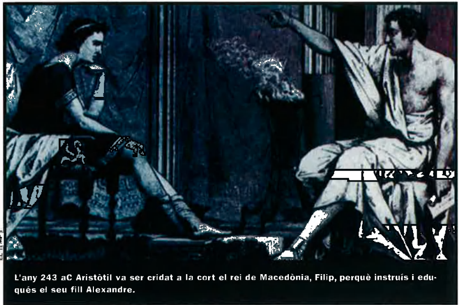
L'any 243 aC Aristòtil va ser cridat a la cort el rei de Macedònia, Filip, perquè instruís i eduqués el seu fill Alexandre.