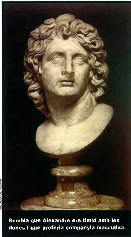
MUSEU DE ROMA

Està clar que els històrics voldrien saber encara més coses sobre les seves activitats privades, com ara que li agradava caçar lleons, que al matí prenia un esmorzar lleuger, i que al vespre, després del bany, sopava i bevia.