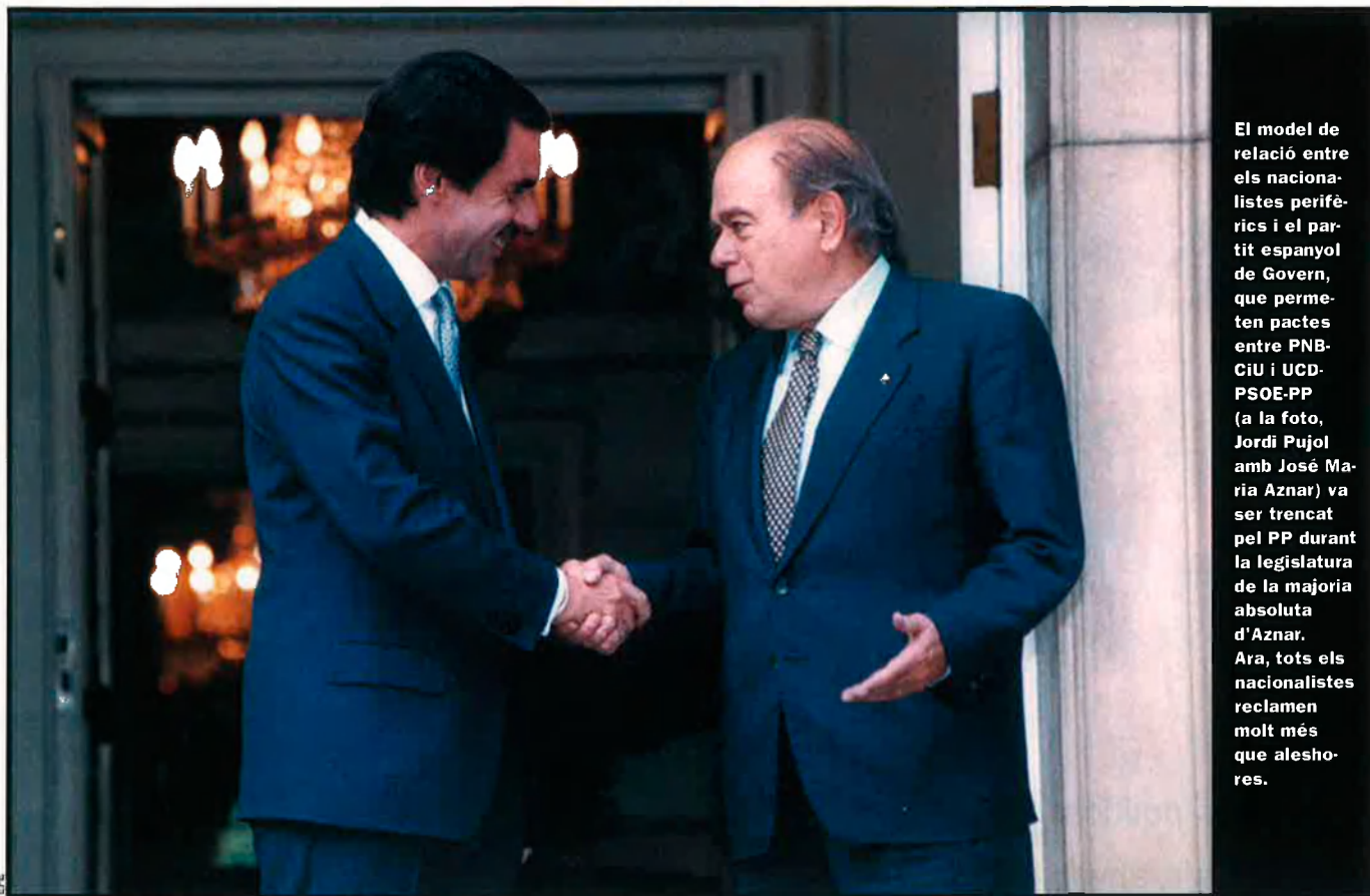
El model de relació entre els nacionalistes perifèrics i el partit espanyol de Govern, que permeten pactes entre PNB-CiU i UCD-PSOE-PP (a la foto, Jordi Pujol amb José María Aznar) va ser trencat pel PP durant la legislatura de la majoria absoluta d'Aznar. Ara, tots els nacionalistes reclamen molt més que aleshores.

portància al fet que així es puguin definir les comunitats autònomes en els respectius Estatuts, el quals, en tot cas, hauran de seguir "dins del marc constitucional" vigent i sotmesos al principi de la "sobirania única" que "recau en el Parlament de la nació".