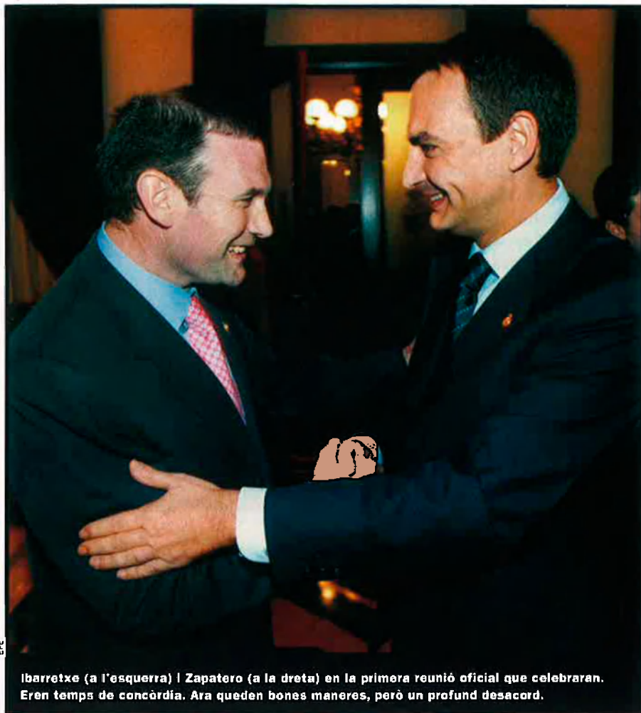
Ibarretxe (a l'esquerra) i Zapatero (a la dreta) en la primera reunió oficial que celebraran. Eren temps de concòrdia. Ara queden bones maneres, però un profund desacord.

El PSOE de Zapatero. Just abans de la victòria electoral del PSOE de José Luis Rodríguez Zapatero, el març de 2004, el nacionalisme català i basc ja era prou diferent d'allò que havia estat en els temps en què el PNB i CiU pactaven a Madrid. Al País Basc ja estava en marxa el pla Ibarretxe, que unia el PNB i EA en el desig de sobirania, enfront del qual se situava la radical oposició tant del PP com del PSOE. A Catalunya, la posició nítidament independentista d'ERC va rebre un gran suport popular en les eleccions de novembre del 2003, amb la qual cosa es va convertir en peça clau del govern tripartit (amb PSC i IC). Però el fet és que, a més, el resultat independentista obligava CiU –sota el lideratge d'Artur Mas–, a la pràctica, a no desdibuixar el caràcter sobiranista, sinó a incrementar-lo. I encara és més, perquè l'èxit d'ERC significava, així mateix, un fàctic apuntament del sector federalista del PSC. És a dir, governaven les dues comunitats forces nacionalistes clarament sobiranis-