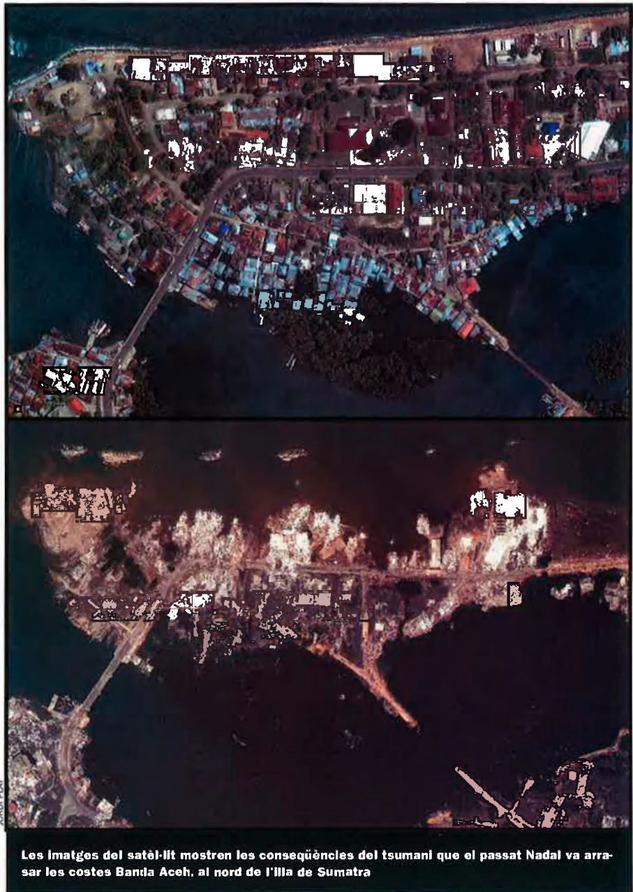
Les imatges del satèl·lit mostren les conseqüències del tsunami que el passat Nadal va arrasar les costes Banda Aceh, al nord de l'illa de Sumatra

Segons Sieh, les plaques terrestres continuen sotmeses a una forta tensió. "Això em posa molt nerviós", diu. Una segona sacsejada s'ajustaria al patró històric: "Ens trobem a l'inici d'un nou cicle". El risc d'un nou i terrible sisme bessó a Sumatra, segons Sieh, "ha augmentat considerablement", però fins que arribi també podrien passar dècades.