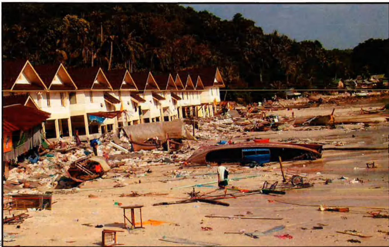
Els efectes de la darrera catàstroe a Sumatra no es podran oblidar en molts anys. el que era antuvi un paradís per als turistes occidentals ha quedat reduït a mort i enderrocs. Una ona gegant, un tsunami es va endur per davant tot el que li barrava el pas.

La fina capa que hi ha entre aquests dos móns, l'escorça terrestre, suporta tot tipus de vida: des d'organismes unicel·lulars fins a elefants.