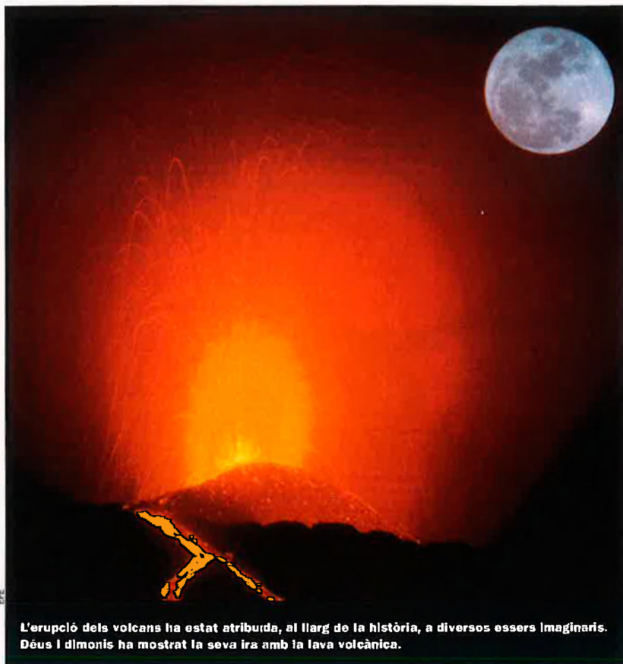
L'erupció dels volcans ha estat atribuïda, al llarg de la història, a diversos éssers imaginaris. Déus i dimonis ha mostrat la seva ira amb la lava volcànica.

Però cap esdeveniment va commoure durant tant temps els europeus d'aquella època com el terratrèmol que va reduir a runes i cendres l'orgullosa i bella ciutat de Lisboa. Les seves torres es movien, segons explicava un testimoni, "com un camp de blat al vent" Els crucifixos queien dels altars de les esglésies. Els habitants fugien a les ribes del Tajo, on