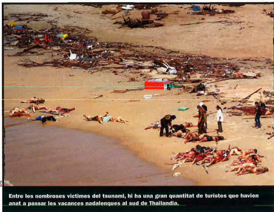
Entre les nombroses víctimes del tsunami, hi ha una gran quantitat de turistes que havien anat a passar les vacances nadalenques al sud de Tailàndia.

En el futur, aquestes alarmes seran més fiables, ja que durant els últims anys s'han instal·lat al fons marí uns sensors de pressió que documenten amb tota exactitud la formació d'un tsunami. Mitjançant una boia que emet ones de ràdio, les dades dels sensors arriben a la superfície i, via satèl·lit, a la central. Amb un programa informàtic especial, al qual s'han introduït mapes, simulacions meteorològi-