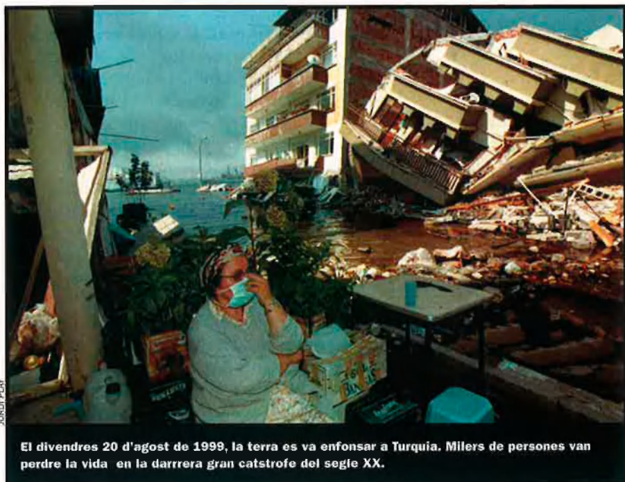
El divendres 20 d'agost de 1999, la terra es va enfonsar a Turquia. Milers de persones van perdre la vida en la darrera gran catstrofe del segle XX.

Tot i això, Wegener només va proporcionar uns fonaments teòrics. Per a entendre detalladament el procés en què la dinàmica interna condueix a aquests cops destructius, els geòlegs van trobar una nova font a finals del segle XIX: els mateixos terratrèmols o, més concretament, les ones de xoc que transmeten a